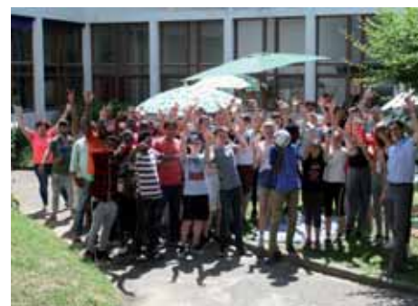
À Bonnelles ce n'étaient que des gens exceptionnels....

temps, j'ai eu mes papiers. En peu de temps, je suis devenu réfugié. En peu de temps, on m'a donné la possibilité d'apprendre le français. Cela fait maintenant quatre ans que je vis en France. J'ai un CDI, je suis informaticien. Rien n'était normal à Bonnelles. Ce n'étaient que des gens exceptionnels, parce que, quand je dois faire des papiers pour des gens qui arrivent, quand je dois me frotter à l'Administration française, je me rends compte qu'à Bonnelles ils étaient exceptionnels.