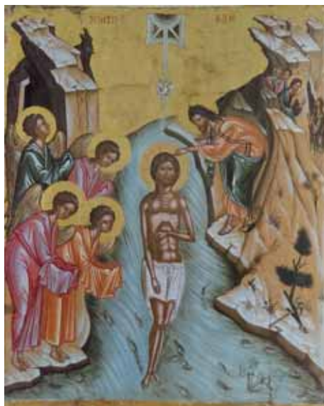
Icône grecque (XVI e siècle) du baptême de Jésus dans le Jourdain.