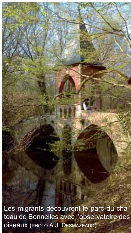
Les migrants découvrent le parc du chateau de Bonnelles avec l'observatoire des oiseaux.

des hommes fatigués, épuisés, timides. La catastrophe annoncée à la télévision a fait place au meilleur accueil des autorités (élus, sous-préfet) et de la population. Tous se sont mobilisés pour rendre vivable un lieu inhabité depuis longtemps, avec des garanties de sécurité (extincteurs, détecteurs de fumée...). Très rapidement 70 habitants de Bonnelles s'étaient inscrits pour venir en aide en offrant du matériel, des couvertures, des vêtements. En même temps, la directrice de l'école maternelle rassurait les parents d'élèves de Bonnelles inquiets.