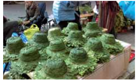
Sur le marché de Riga, vente de couronnes de fleurs et de chapeaux de feuilles d'érable pour célébrer la Saint-Jean.