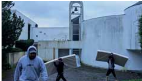
Le Monastère des Orantes.

B onnelles est une commune des Yvelines de 2000 habitants, à mi-chemin entre Paris et Chartres. Elle est située dans le Parc Naturel Régional de la Haute Vallée de Chevreuse dont Guy Poupart est le vice-président. C'est en tant que maire de Bonnelles qu'il a été, en 2015, sollicité par la préfecture des Yvelines pour accueillir des migrants dans le Monastère des Orantes.