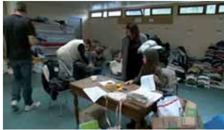
70 habitants de Bonnelles s'étaient inscrits pour venir en aide en offrant du matériel, des couvertures, des vêtements...

Très rapidement la peur côté français s'est atténuée, la population voyant arriver