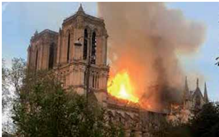
Notre-Dame de Paris en feu le lundi 15 avril 2019