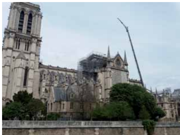
Notre-Dame de Paris mardi 7 mai 2019

Une visite à Notre-Dame de Paris, c'est une rencontre. Une rencontre avec ses visiteurs, entre les visiteurs, avec la cathédrale, une autre rencontre aussi, peut-être.