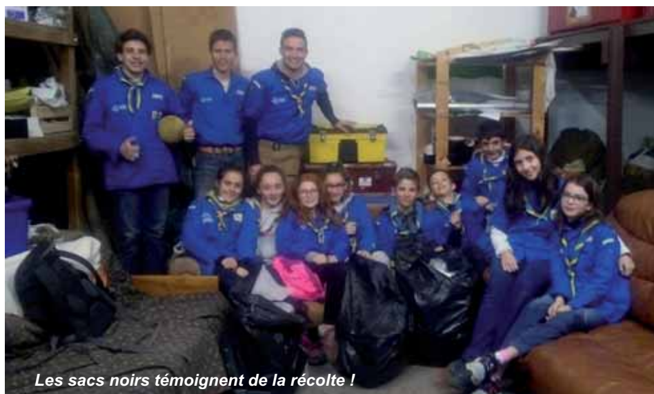
Les sacs noirs témoignent de la récolte !

Le 16 mars dernier, la "tribu2" des SGDF d'Orsay a retroussé ses manches. Armés de sacs plastiques et de boussoles, les "bleus" ont passé la journée à ramasser les déchets qu'ils trouvaient sur leur route.